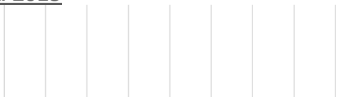
Aantal pat./aantal med. attenties CMBC. Peru 2015