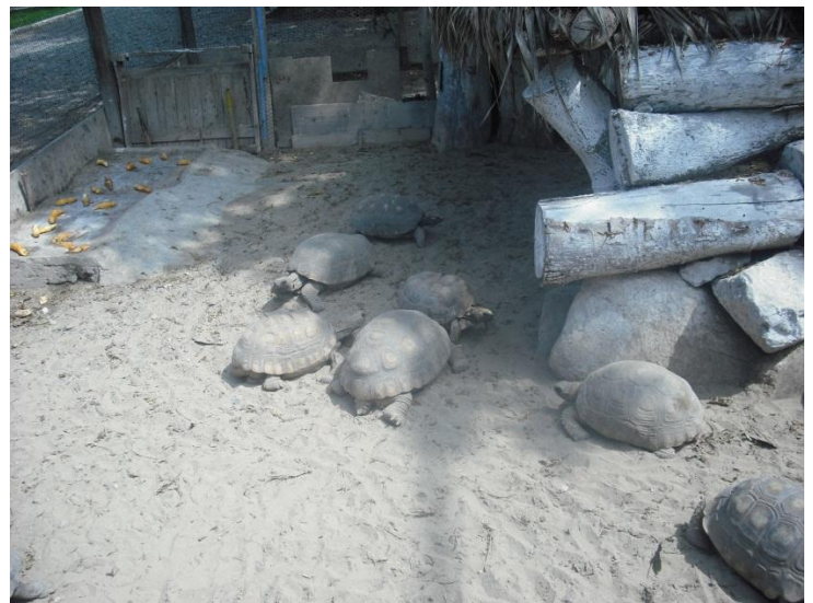
Een koraal met schildpadden

Geneeskunde, theorie volbracht!! Nov 2012