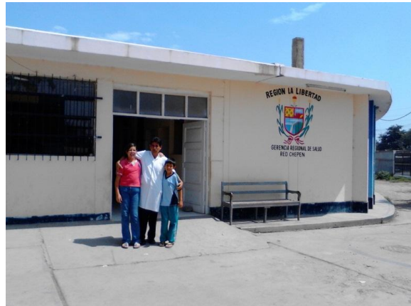
dochter en zoon bij vader op bezoek in ZH Chapén

En zo staan we als gezin voor veranderingen die groter wordende kinderen meebrengen. De oudste op weg naar de vervolgstudie, de stad verlaten, Nederland? Voor hoelang?.... Ik zit volop in de afwerking van het jaar hier, en voorbereidingen van 4 personen, één voor één, en het moet ook nog samen passen... etc. De dokter blijft in ieder geval op de basis Betesda, met de bijbehorende campagnes en het vaste werk in het districtsziekenhuis. Het was wel leuk, dat onze oudste vanuit het Fleming College in de stad voorstelde om zijn verplichte beroepsstage in Chapén te doen, 'om de realiteit van de achterblijvende zones van Peru ook te ervaren'. Dat was voor onze oudste natuurlijk een kwestie van de zaak op papier zetten, want de kinderen zijn met ons van alle markten thuis. Vader en zoon genoten. Evenzo onze dochter en jongste zoon, die in hun vakantie, die verschillend gespreid zijn (geluk of ongeluk?!), om de beurt met hun vader in Betesda meeliepen die dagen.