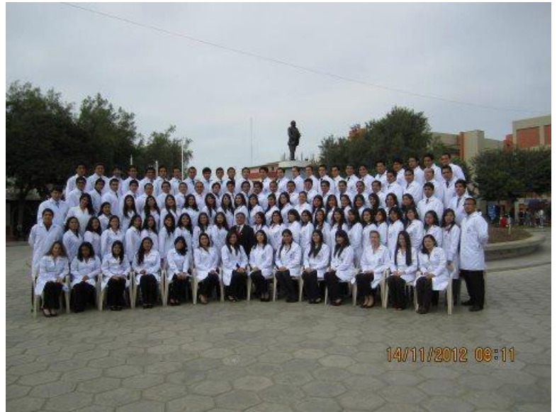
De doktersvrouw: Nu op naar de bul, maar de universiteit lieten we achter. nov 2012