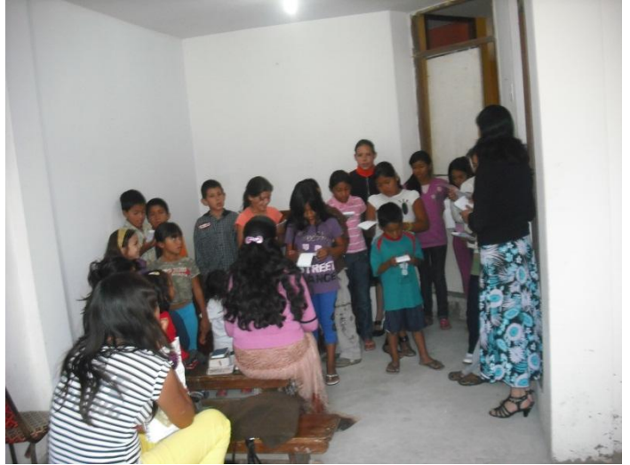
Zondagschoolkinderen in het kerkzaaltje, Trujillo