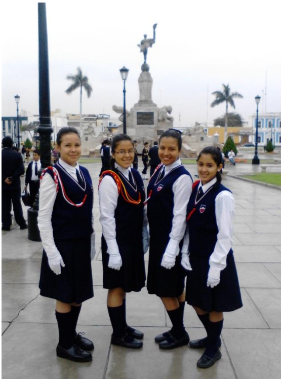
Onze dochter: Met school defileren en marcheren op de Plaza Mayor van Trujillo