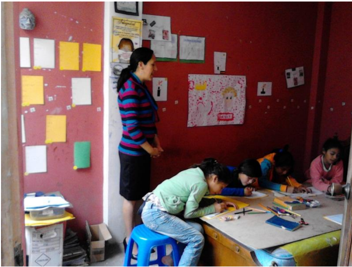
Triplex op een bed, en je hebt een kindertafel voor tien op de zondagsschool