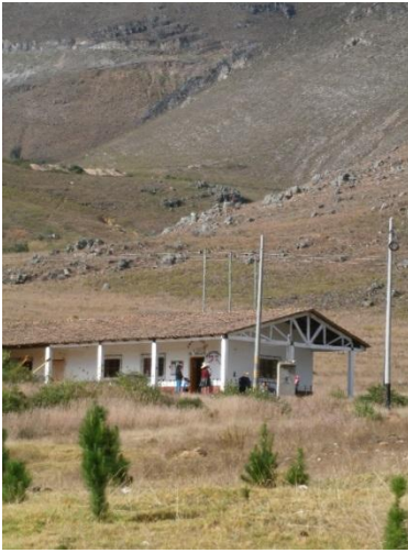
6). A.- Een eenzaam gelegen bergschooltje vroeg om hulp.