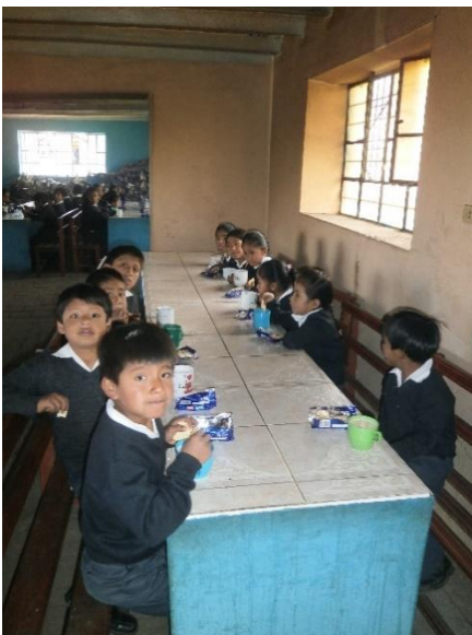
6). C.- Lekker melk met een pakje droge koekjes.