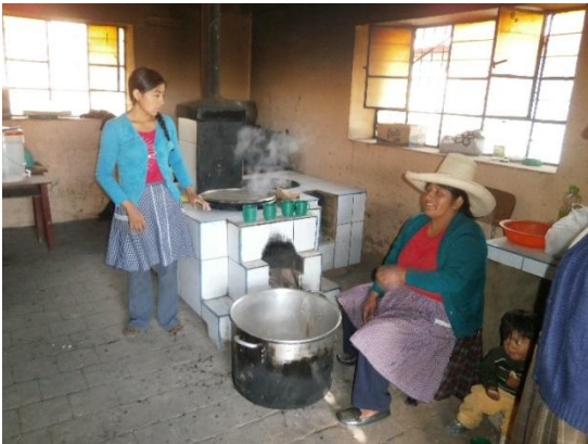
6). B.- Het schoolontbijt was net gekookt en opgediend toen we aankwamen.